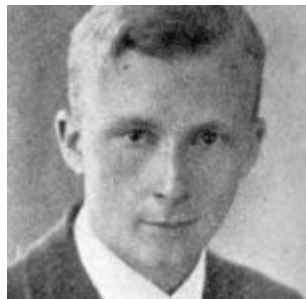
Cecil PURDY (Australie)

1er Champion du Monde par correspondance 1950 – 1953