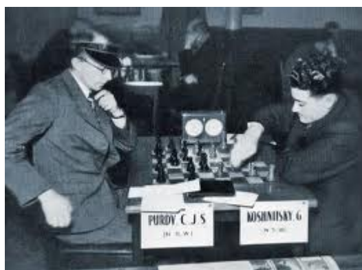
Cecil PURDY devant l'échiquier.

Cecil PURDY était Maître International du jeu d'échecs (1951) et Grand Maître du jeu d'échecs par correspondance (1953), célèbre pour avoir été le premier Champion du monde par correspondance I.C.C.F. entre 1950 et 1953. Il était également l'auteur d'ouvrages échiqués.