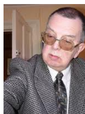
Nikolay KROGIUS (Russie)

Deux grands spécialistes des finales et auteurs de nombreux ouvrages résument la technique gagnante pour le camp ayant le pion par ces 6 étapes, dite aussi méthode de "construction du pont" .